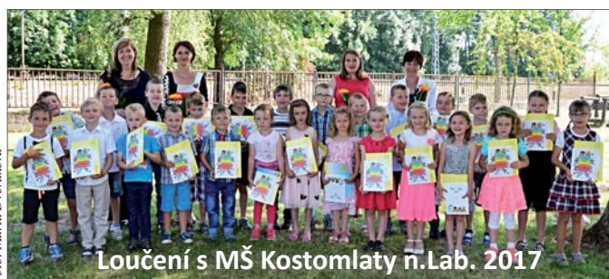
Loučení s MŠ Kostomlaty n.Lab. 2017

Co se týče dalšího vývoje obce, bylo by dobré zlepšit komunikaci vedení obce se zastupiteli, aby se podařilo co nejvíce rozdělaných projektů dokončit, a pak také nesmíme zapomenout na okolní obce. Občany bych chtěla vyzvat, aby se více zajímali o veřejné dění a účastnili se života v obci. Přejí sobě i jim, aby se vše dařilo a společně se nám tu dobře žilo.