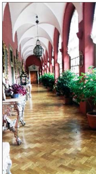
květinová chodba v italském stylu