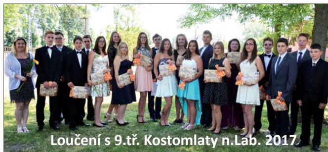
Loučení s 9.tř. Kostomlaty n.Lab. 2017